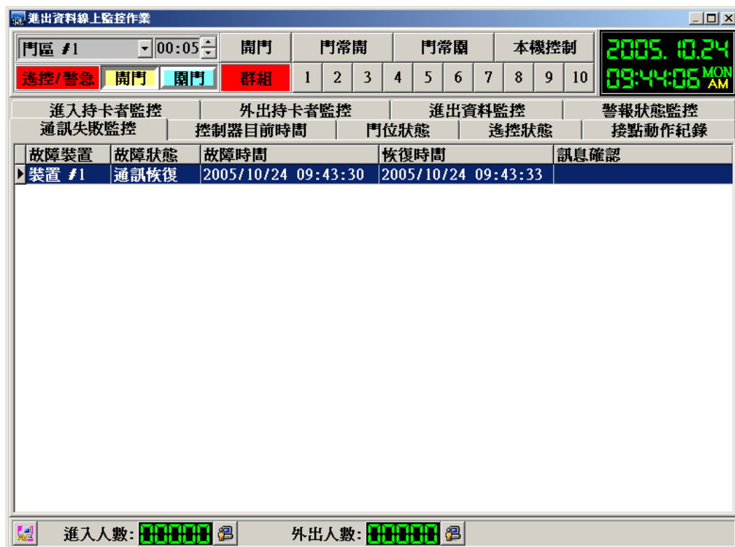
進出資料線上監控作業 - 通訊失敗監控流覽畫面