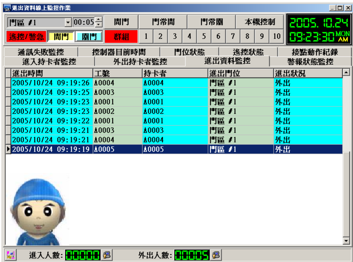
進出資料線上監控作業 - 進出資料監控瀏覽畫面