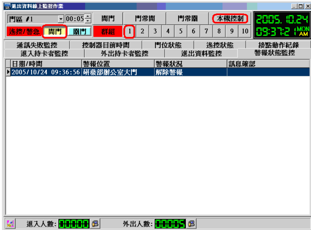
進出資料線上監控作業 - 警報狀態監控流覽畫面

(此功能設定在”門禁參數管理”功能選項”緊急門區設定作業”) 設定完成需重新啓動SOFT-230軟體才會生效設定值。